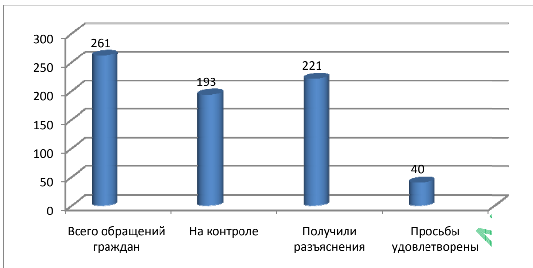
Рис. 1. Обращения граждан городского округа за 2020 год

Жители городского округа, которые обращались в органы местного самоуправления, получили исчерпывающие ответы на поставленные вопросы, просьбы были удовлетворены в количестве 261 обращение [3, с. 34].