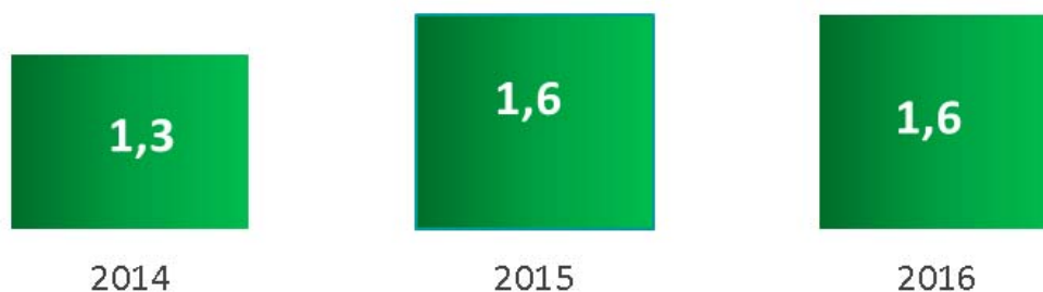
Рис. 2. Уровень регистрируемой безработицы, %

Отношение количества безработных к общей численности экономически активного населения в процентах определяется как уровень безработицы (рис. 2).