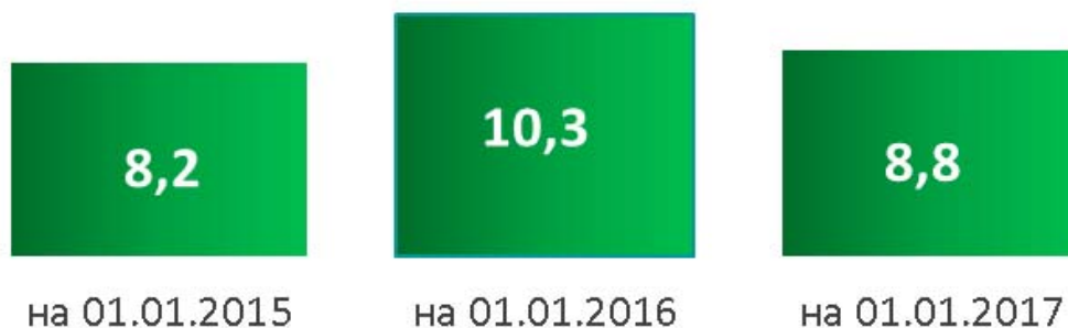
Рис. 1. Численность безработных граждан, тыс. чел

Ситуация на рынке труда Вологодской области в 2016 году характеризуется следующими показателями (рис. 1).