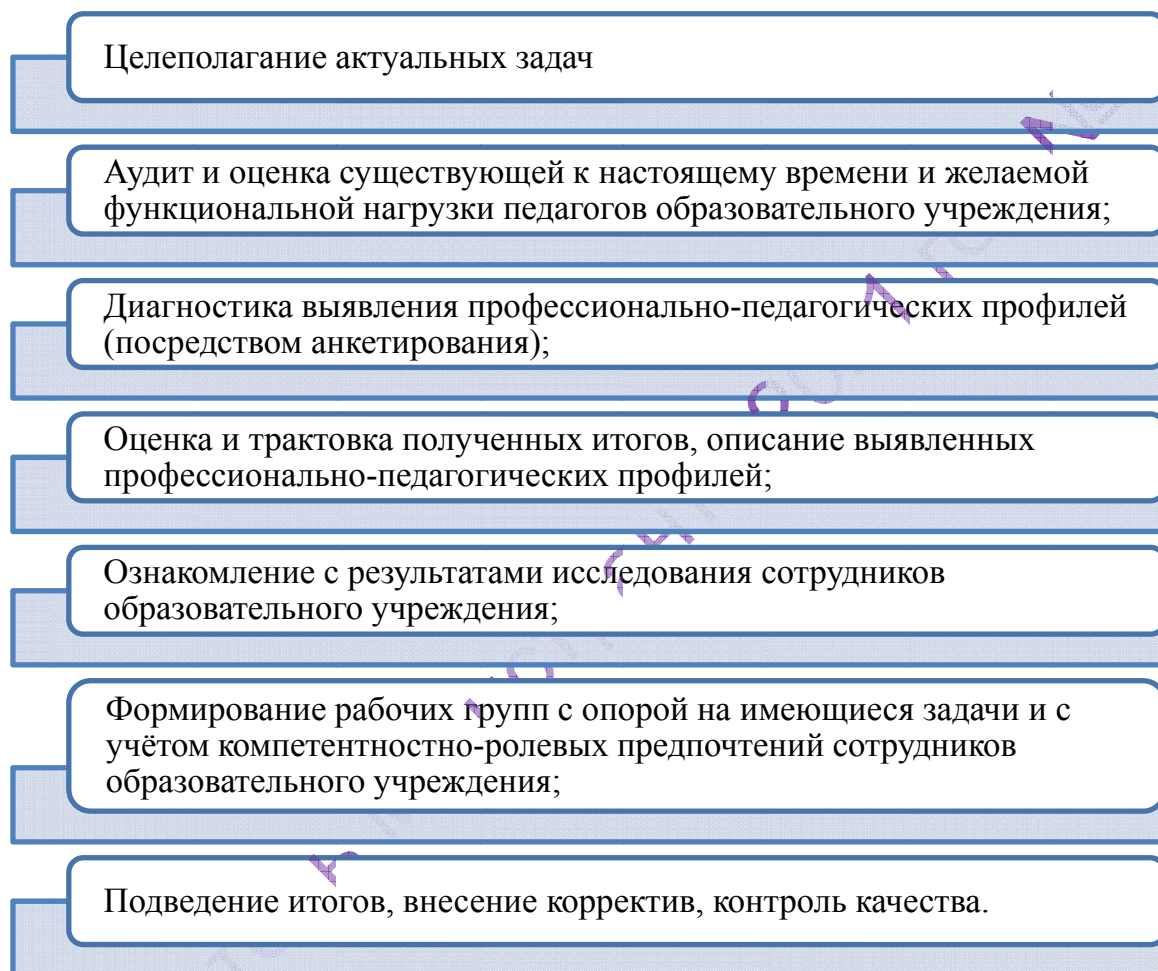
Рис. 1. Стадии разработки схемы управления

Полагаем следующие стадии разработки заявленной схемы управления (рис. 1).