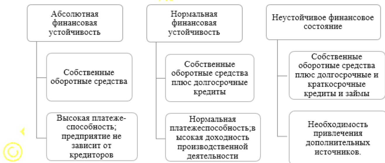
Рис. 2. Типы финансовой устойчивости предприятия [4, с. 452]

Следовательно, финансовая устойчивость деятельности коммерческого предприятия, сущность которой заключена в эффективном формировании собственного и заемного капитала, является одним из значимых этапов проведения экономического анализа предприятия. Оценить финансовую устойчивость деятельности коммерческой организации можно путем расчета покрытия запасов различными источниками финансирования. На основании такого анализа определяется тип финансовой устойчивости (рис. 2).